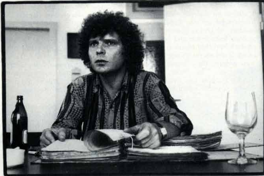
Wie alles anfing: Die Akten des 'Club Liberitas'.

Bauer zog mit den großen Konzerten in Schulaulen.